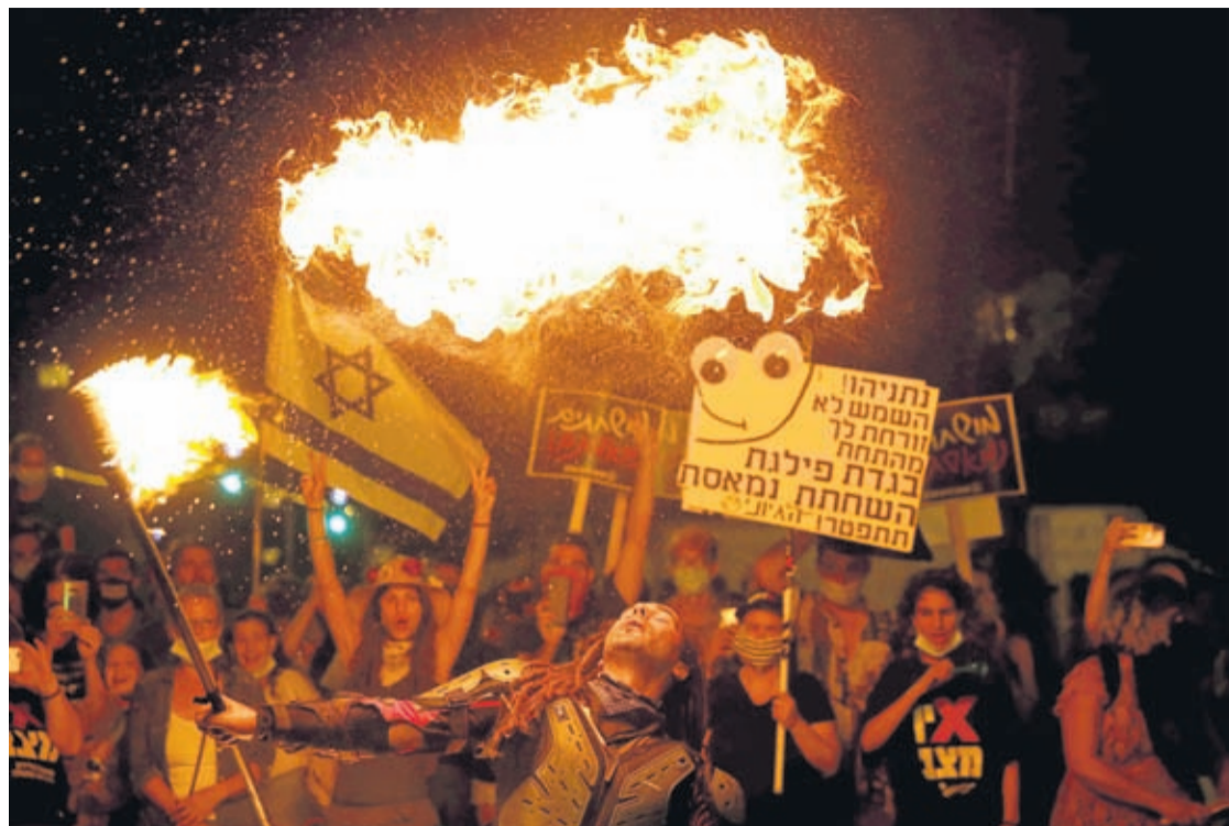
A performer dance with fire during a protest in front of Israel's Prime Minister's residence in Jerusalem, Thursday, July 16, 2020.

Gyms and exercise studios will be closed except for use by competitive athletes and beaches will be closed on weekends, beginning later this month. The Israeli weekend is Friday and Saturday. Restaurants were initially ordered to halt seated dining by Friday evening, but the government later backtracked in the face of an uproar by owners who said they had already purchased fresh ingredients for the weekend rush and would suffer major financial losses if they had to throw them out. In a statement released Friday afternoon,